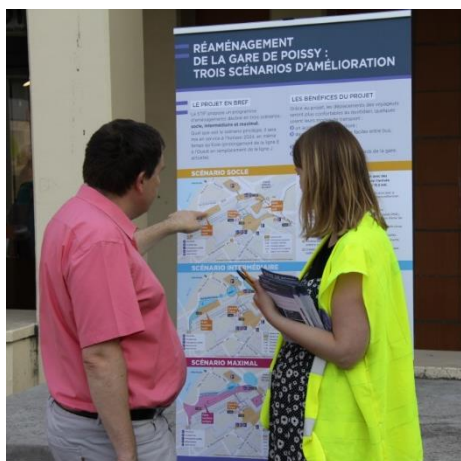
Stand parvis sud