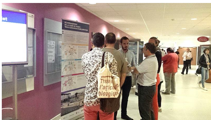
Stand pôle 1